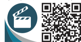
Inquadra questo QR code con il tuo smartphone

realizzato nell'ambito delle politiche per l'invecchiamento attivo promosso e finanziato da Regione Lombardia. "È fondamentale svolgere attività, perché ci permette di prevenire altre eventuali patologie, quali ad esempio osteoporosi, artrosi o la sindrome ipocinetica - conclude Massimo Romanò".