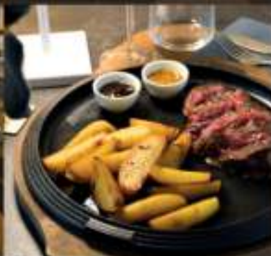
Ricco menu alla carta con materie prime selezionate