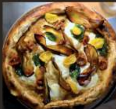
Pizze di stagione sempre nuove