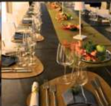
Cene aziendali e feste private