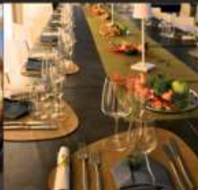
Cene aziendali e feste private