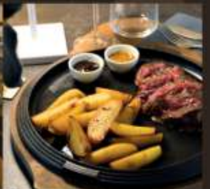
Ricco menu alla carta con materie prime selezionate