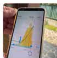
App di controllo