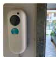
Sistema di ricarica veicoli elettrici