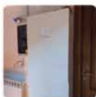
Sistema di accumulo sonnenBatterie