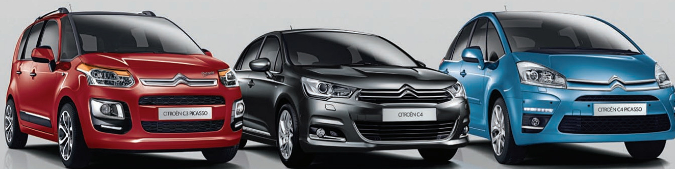
CITROËN C3 PICASSO