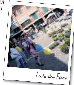
Festa dei Fiori