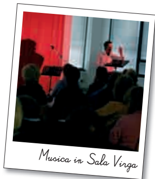
Musica in Sala Virga