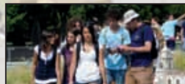
► Tradizioni - pag. 22/23 I colori dell'estate dei ragazzi