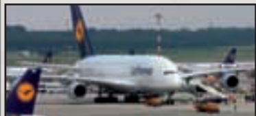
► Attualità - pag. 3 Il 'gigante dei cieli' a Malpensa