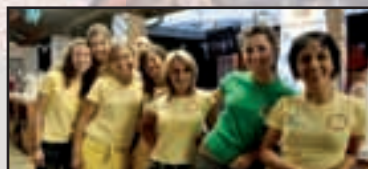
► Inveruno - pag. 17 Voglia di festa con 'Rockantina'