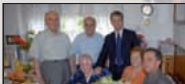
► Castano e Magnago - 15 e 20 Due storie di nostri centenari