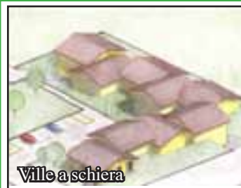
Ville a schiera

CASTANO PRIMO: Ville a schiera disposte su un unico livello con taverna e giardino. Ottimo capitolato che prevede anche pannelli solari e riscaldamento a pavimento. Zona signorile immersa nel verde.