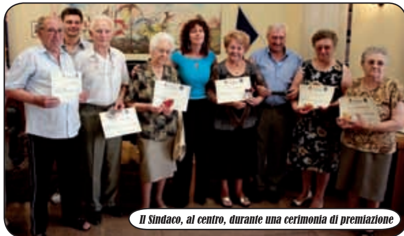
Il Sindaco, al centro, durante una cerimonia di premiazione

ricordo di una signora che mi disse: "Ci vuole proprio una donna in Comune, perché una donna sa come gestire bene le cose". Mi colpì moltissimo la modernità delle idee di quella persona che, senza dubbio, vedeva la donna come colei che manda avanti la casa. In fondo, un Comune assomiglia molto ad una famiglia allargata che comprende tutti i cittadini. Insomma, sono dalla parte della donna moderna, che amplia i suoi ruoli. L'importante è che la figura femminile non sia avvantaggiata in quanto tale: pari opportunità significa, appunto, avere le stesse possibilità dei nostri colleghi maschi, ma la donna non vale solo in quanto donna! Anche lei deve dimostrare di avere delle qualità e capacità". Non stupisce, allora, che la Festa della Donna a Robecchetto sia un evento entrato, di diritto, nel calendario dei suoi residenti; per quest'anno è stata organizzata una cena a buffet che si terrà questa sera, 6 marzo, presso le scuole Elementari e che sarà allietata da 'Gente in Comune', band di ex amministratori. Ci sarà spazio anche per la presentazione del nuovo corso di autodifesa per le donne, nonché per la solidarietà: parte del ricavato andrà, infatti, alla 'Fondazione Francesca Rava', a sostegno delle popolazioni terremotate di Haiti. "Una festa per le donne, ma anche per tutti gli uomini che le vogliono festeggiare".