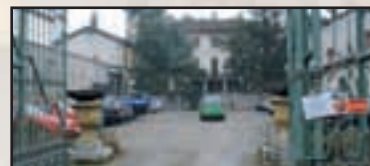
► Buscate - pag. 17 'Stop' al parcheggio in centro