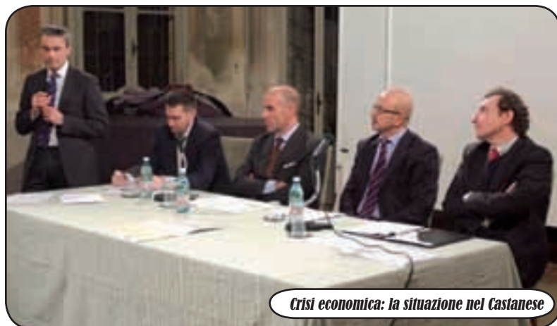
Crisi economica: la situazione nel Castanese