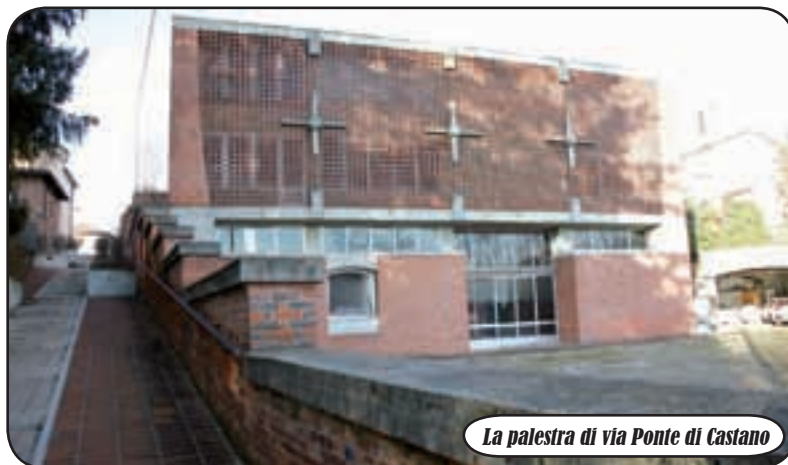
La palestra di via Ponte di Castano

A pprovato, a Nosate, il nuovo regolamento per l'uso della palestra comunale, che si trova al piano terra dell'edificio scolastico di via Ponte di Castano. La struttura è stata appena rimessa a norma, nell'ambito di un progetto per la rimozione delle barriere architettoniche, con la risistemazione dei servizi igienici e la realizzazione di un montacarichi semi-esterno per consentire l'accesso anche a persone con mobilità ridotta. Dopo l'interruzione d'uso dovuta proprio ai cantieri, quindi,