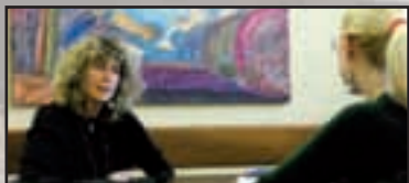
► Festa della Donna - pag. 7 Quando donna è... successo