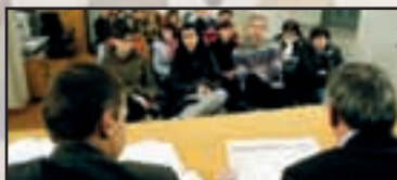
► Inveruno - pag. 13 Un confronto sui trasporti