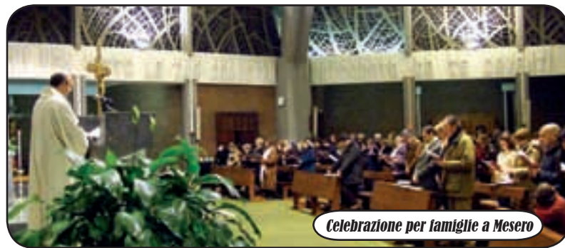
Celebrazione per famiglie a Mesero

alle 14.45. Dopo un momento di accoglienza presso il cimitero, con preghiera di fronte alla tomba della Santa, vi sarà un percorso di introduzione. Giunti al Santuario, rappresentazione teatrale dell'opera 'La bottega dell'Orefice', scritta da Karol Wojtyła, curata dalla compagnia teatrale 'Khorakhanè'. Un intervento di Mons. Delpini proporrà il tema della giornata con una particolare attenzione al valore evangelico e al significato che una