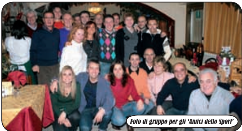
Foto di gruppo per gli 'Amici dello Sport'