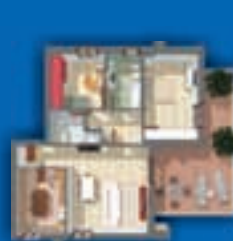
3 LOCALI - 114 mq. con cucina abitabile, doppi servizi e terrazzo