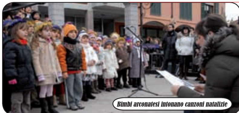
Bimbi arconatesi intonano canzoni natalizie

bertà, nel pomeriggio le musiche di Natale del Corpo Bandistico Santa Cecilia si sono affiancate alle canzoni dei bambini delle elementari e della scuola dell'infanzia. Inoltre il Gruppo Folkloristico, organizzatore insieme al Comune della manifestazione, ha offerto una cioccolata calda a tutti i presenti. Quando già si faceva sera, i riflettori si sono spostati nella palestra delle scuole medie, dove sono stati assegnati diversi premi e onorificenze. In particolare, un premio speciale