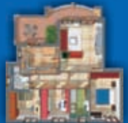
4 LOCALI - 128 mq. con cucina abitabile, doppi servizi e terrazzo