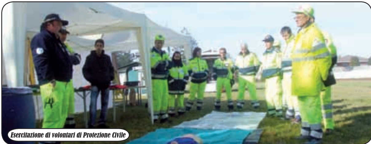
Esercitazione di volontari di Protezione Civile