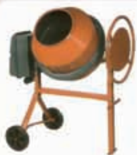
BETONIERA ELETTRICA LT. 162

Un piccolo esempio dei numerosi articoli a noleggio