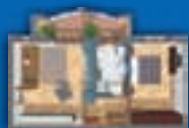
2 LOCALI - 69 mq. con angolo cottura e balcone

APPARTAMENTI 2 - 3 - 4 LOCALI tipologie con giardini o terrazzi in PRONTA CONSEGNA