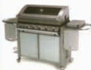
BARBECUE A GAS C/FORNO E FORNELLO