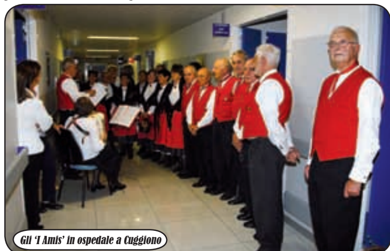
Gli 'I Amis' in ospedale a Cuggiono