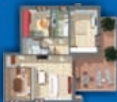
3 LOCALI - 114 mq. con cucina abitabile, doppi servizi e terrazzo