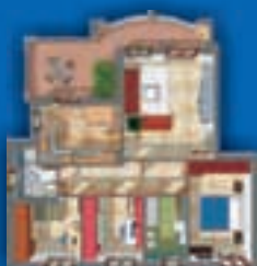
4 LOCALI - 128 mq. con cucina abitabile, doppi servizi e terrazzo