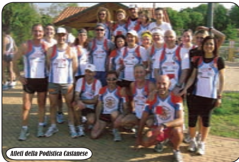
Atleti della Podistica Castanese

E la passione l'ingrediente principale che ne ha fatto un gruppo vincente ed eccezionale. Se a questa si aggiungono, poi, l'impegno, la collaborazione ed il lavoro costante, ecco che si arriva all'Associazione Sportiva Dilettantistica 'Amici dello Sport Podistica Castanese' di Castano Primo. Tanti gli appuntamenti che hanno visto protagonisti i 'nostri' atleti e numerosi quelli, invece, in calendario, tra maratone e mezza maratone. La società, composta da 38 tesserati alla FIDAL e 19 simpatizzanti, in queste settimane, si sta, infatti, preparando per la gara di Firenze, in programma alla fine di novembre, con un occhio particolare anche alle altre competizioni in programma, in Italia, in Europa, nel Mondo e nel territorio. "Ci ritroviamo, in più occasioni, durante la settimana - ci hanno detto - il martedì ed il giovedì al Campo