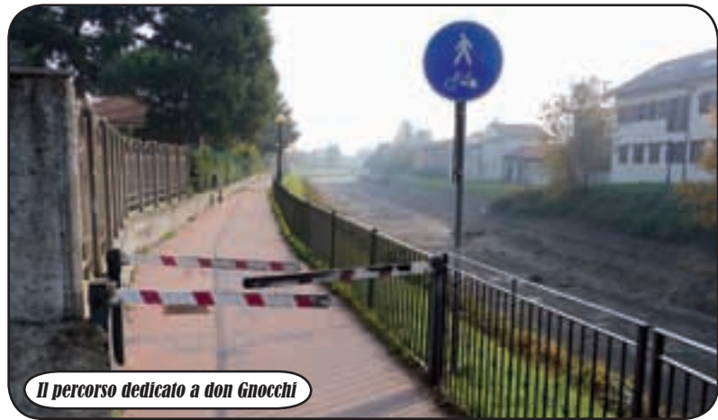
Il percorso dedicato a don Gnocchi