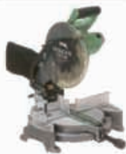
TRONCATRICE DA LEGNO