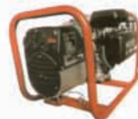
GRUPPO ELETTROGENO 3200 W