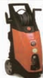
IDROPULITRICE AD ACQUA FREDDA

gamma in costante aumento per soddisfare le vostre richieste