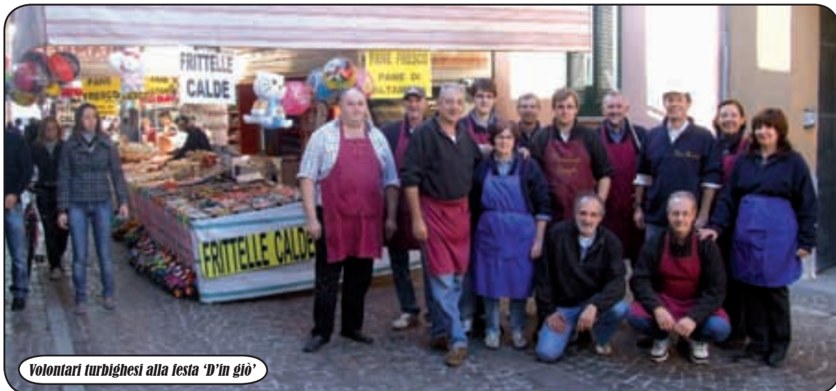
Volontari turbighesi alla festa 'D'in giù'