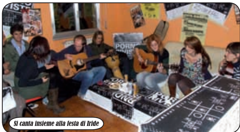
Si canta insieme alla festa di Iride

dall'ormai noto social network Facebook, attraverso cui gli organizzatori hanno inoltrato inviti virtuali a diverse persone che, a loro volta, li hanno fatti recapitare ad altri. Si è creato, così, un passaparola on-line che ha portato a un risultato decisamente positivo, anche per la piacevole presenza di persone provenienti da altri paesi. A detta dei partecipanti, l'happy hours è piaciuto molto ed è proprio questo riscontro e la voglia di coinvolgere e divertire le persone che spinge 'Iride' nel continuare ad organizzare eventi e manifestazioni di questo genere. Iniziative ancor più di valore perchè organizzate dai giovani per i loro stessi coetanei.