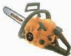
MOTOSEGA 49 CC. BARRA 45 CM.