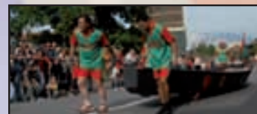
► Turbigo - pag. 20 La Patronale dal...sapore antico