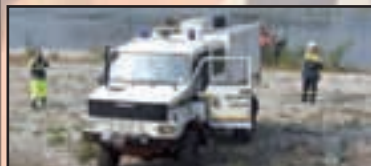
► Attualità - pag. 3 30 anni da volontari del Parco