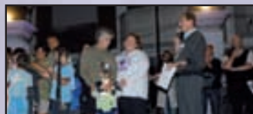
► Arconate - pag. 17 Una 'Stranotturna' per la pace