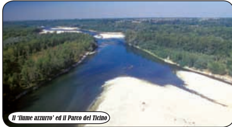
Il 'fiume azzurro' ed il Parco del Ticino

T rent'anni di attività e circa 270 operatori. Stiamo parlando del 'Corpo Volontari del Parco del Ticino' che negli scorsi giorni ha raggiunto il terzo decennale di fondazione. Ritorniamo quindi al 1974, quando venne ufficialmente istituito il Parco della Valle del Ticino, con la necessaria priorità di realizzare una struttura in grado di proteggere i boschi dagli incendi. Ad aprire la strada dell'odierno Corpo Volontari fu il Servizio Antincendio Boschivo