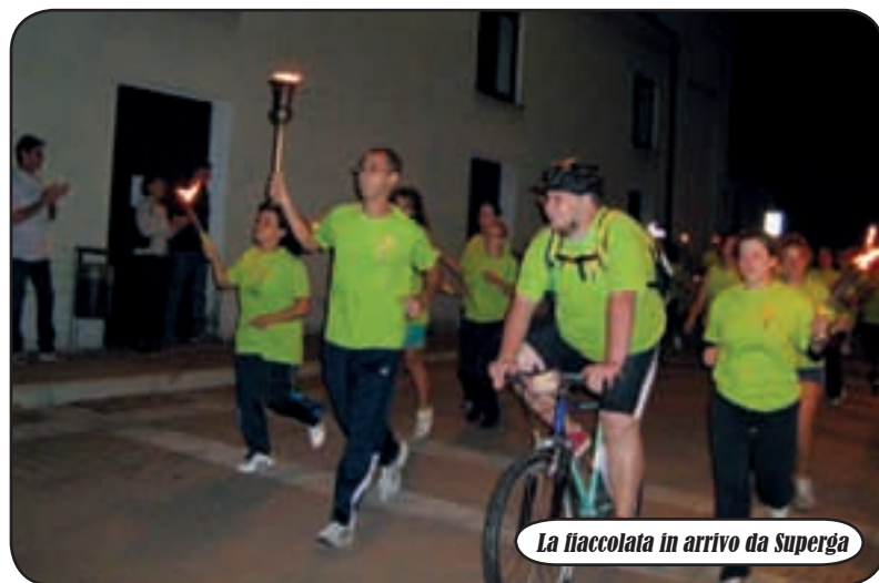
La fiaccolata in arrivo da Superga

P oco più di mille abitanti e mille occasioni per stare insieme e condividere le radici della tradizione paesana. La Festa Patronale di Casate ha offerto l'ultimo atto di tre settimane ricche di appuntamenti coinvolgenti. Dal 30 agosto si sono alternate occasioni