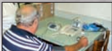
► Castano Primo - pag. 9 Un progetto per i nostri nonni