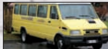
► Nosate - pag. 17 In arrivo un nuovo scuolabus