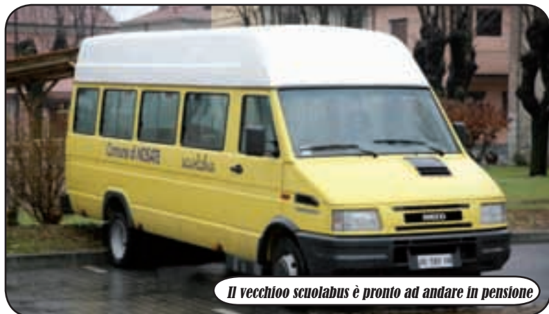
Il vecchio scuolabus è pronto ad andare in pensione

è stata un mezzo da 43 posti, con tre cosiddetti di servizio, ovvero per il personale. Il veicolo continuerà a trasportare gli studenti delle Materne, Elementari e Medie e potrebbe essere operativo, già, per la primavera prossima. Nel frattempo, l'Amministrazione Comunale sta cercando di ottenere fondi dalla Regione, che potrebbero arrivare fino al cinquanta per cento della spesa, per far economicamente pesare il meno possibile l'acquisto. Nosate pensa al suo futuro preventivando una nuova crescita: proprio per questo non si è lesinato sulla capienza del veicolo, pensando non solo ai bambini di oggi, ma anche a quelli di domani.