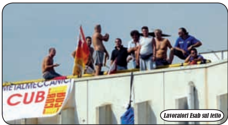
Lavoratori Esab sul tetto