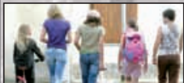
► Speciale scuola - pag. 7 Si ricomincia: studenti e riforme