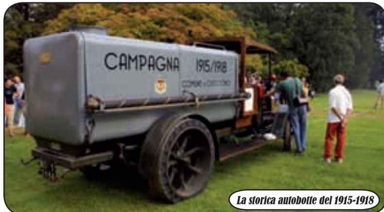
La storica autobotte del 1915-1918

G iunge ormai alla 26a edizione la 'Sagra del Baragioeu', in programma questa domenica 13 settembre a Cuggiono. L'iniziativa è curata dal 'Museo Storico Civico' in collaborazione con i commercianti e l'Amministrazione comunale. In occasione dei 200 anni dall'edificazione della suggestiva Villa Annoni, le iniziative si concentreranno negli spazi del chiostro e dell'aia. Si inizia alle 10 con le