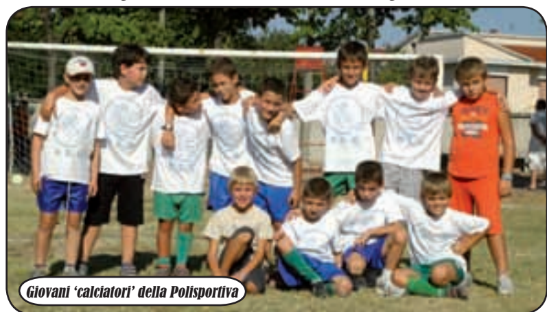
Giovani 'calcianti' della Polisportiva

formazioni, ma soprattutto con tanti momenti di gioco e divertimento per grandi e piccoli. "Lo scopo della Polisportiva - ci spiegano alcuni responsabili - è l'organizzazione di attività sportive dilettantistiche aperte a tutti, la proposta costante dello sport ai giovani ed ai ragazzi, nonché l'impegno affinché, nel territorio in cui opera, vengano istituiti servizi stabili per la pratica e l'assistenza durante le varie discipline. L'appoggio di sponsor permetterà, inoltre, di contenere i costi". La stagione ha inizio!