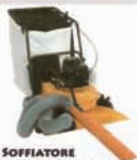
SOFFIATORE ASPIRATORE A SCOPPIO BOCCA DI ASPIRAZIONE DI 76 CM.