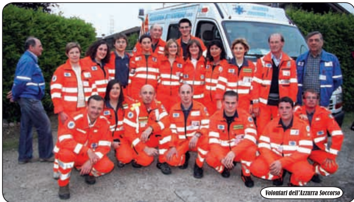
Volontari dell'Azzurra Soccorso

C orsi di Primo Soccorso a Cuggiono per gestire ogni emergenza e, perché no, entrare nel mondo del volontariato. L'Associazione 'Azzurra Soccorso Onlus' organizza, infatti, un corso di 40 ore per conoscere, appunto, le tecniche di Primo Soccorso. Le lezioni prenderanno il via il 28 settembre prossimo e si terranno ogni lunedì e giovedì, dalle 21 alle 23, presso l'Istituto Canossiano di via Concordato 8, a Cuggiono. Al termine verrà rilasciato un attestato di partecipazione oppure si potrà sostenere un esame per ottenere il certificato di Primo Soccorso valido anche per la Legge Sicurezza sul Lavoro (D.L. 81/08, ex D.L.626). La quota di partecipazione è di 15 euro e bisogna iscriversi contattando l'Azzurra Soccorso Onlus (in via Roma 2 a Cuggiono), telefono 0297240032 o 3663274964 (www.azzurrasoccorso.it e azzurrasoccorso@alice.it). Il Corso è per tutti ed è aperta (ma non vincolante) la possibilità di diventare volontari presso il gruppo cuggionese; l'As-