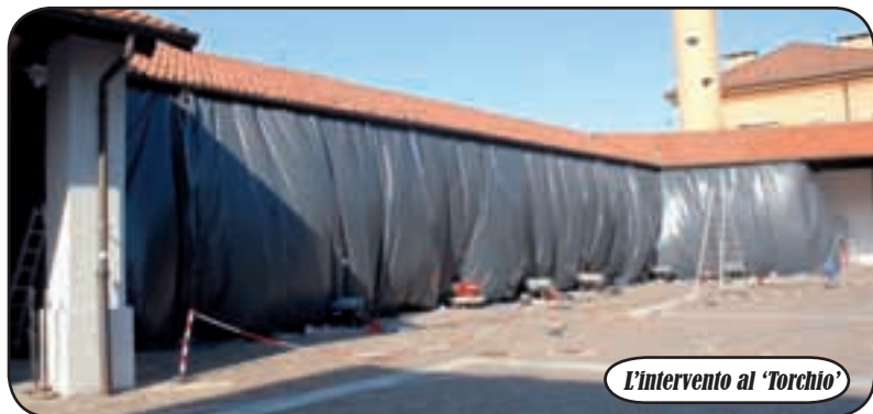
L'intervento al 'Torchio'

di manutenzione e conservazione allo scopo di difendere la struttura lignea da insetti e da generali deterioramenti del tempo. Si tratta di un nuovo e naturale trattamento antitarlo aerotermico che consente, con l'utilizzo esclusivamente di aria calda opportunamente convogliata sul manufatto da trattare, di rimuovere tarli e uova di tarlo in qualunque stadio vitale, senza bisogno di evacuare gli ambienti e senza utilizzare prodotti tossici. La spesa pari a 15 mila euro sarà sostenuta in gran parte dal finanziamento della fondazione Ticino Olona e il risultato sarà un ritorno all'antico splendore di una parte del passato della storia di Inveruno.