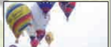
► Nosate - pag. 18 "Io, arbitro per le mongolfiere"