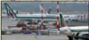
► Attualità - pag. 3 La Terza Pista a Malpensa