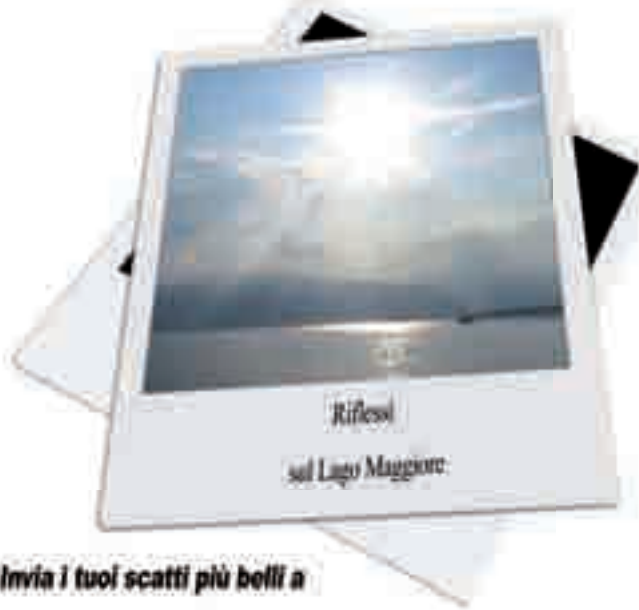
Foto della Settimana