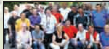
► Buscate - pag. 13 40 anni con il Moto Club