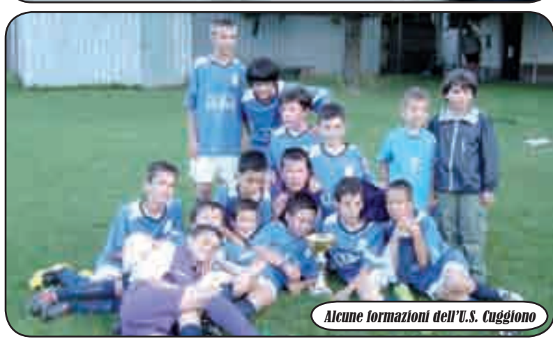
Alcune formazioni dell'U.S. Cuggiono