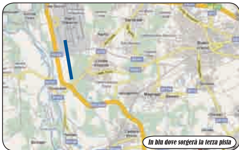
In blu dove sorgerà la terza pista