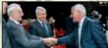
► Territorio - pag. 8 Un premio per il suo lavoro