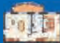
2 LOCALI - 69 mq. con angolo cottura