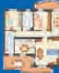
4 LOCALI - 143 mq. con cucina abitabile, doppi servizi e terrazzo

Per INFORMAZIONI e VISITE SENZA IMPEGNO vi aspettiamo presso l'UFFICIO VENDITE in cantiere - via J.F. Kennedy orari di apertura: sabato 9.00/12.30 - 14.00/18.00