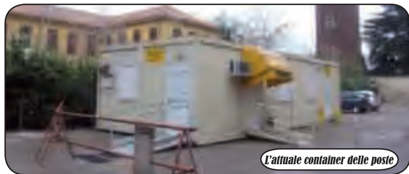
L'attuale container delle poste

dell'ufficio postale di Cuggiono dalla sede provvisoria ai locali di proprietà comunale, Poste Italiane desidera informare i cittadini che è stato autorizzato l'investimento per l'esecuzione dei lavori. I locali messi a disposizione dall'Amministrazione comunale saranno infatti interessati da una serie di interventi di adattamento dello stabile alle esigenze dell'ufficio postale al fine di garantirne efficienza operativa, funzionalità, sicurezza e accoglienza. L'esecuzione dei lavori è prevista per l'anno in corso".