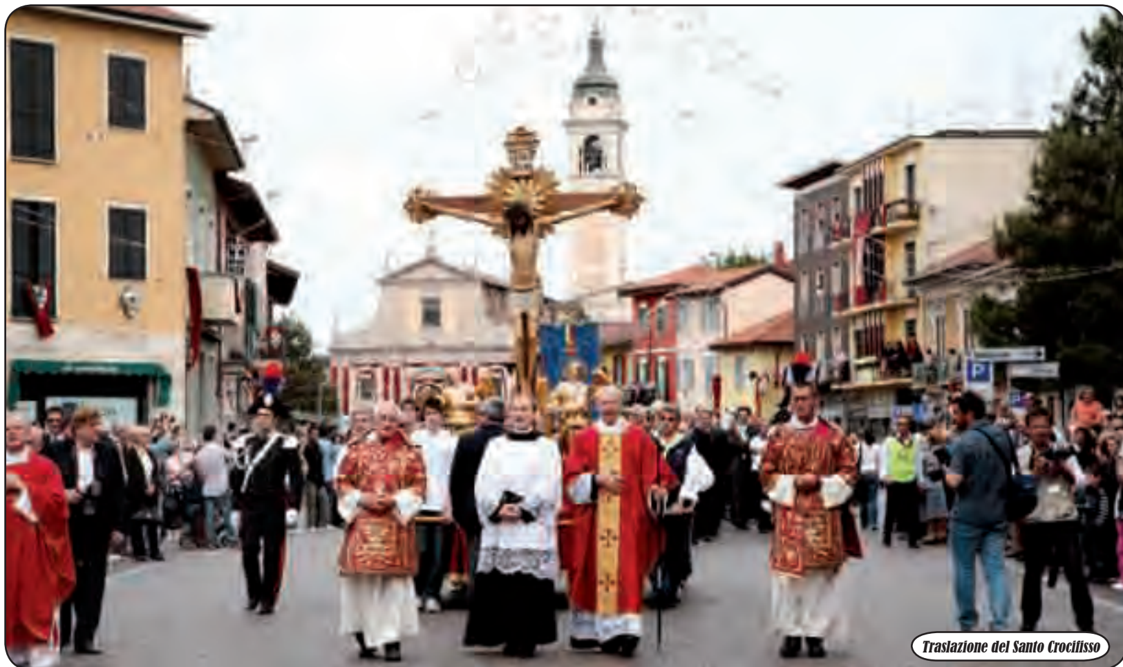
Traslazione del Santo Crocifisso