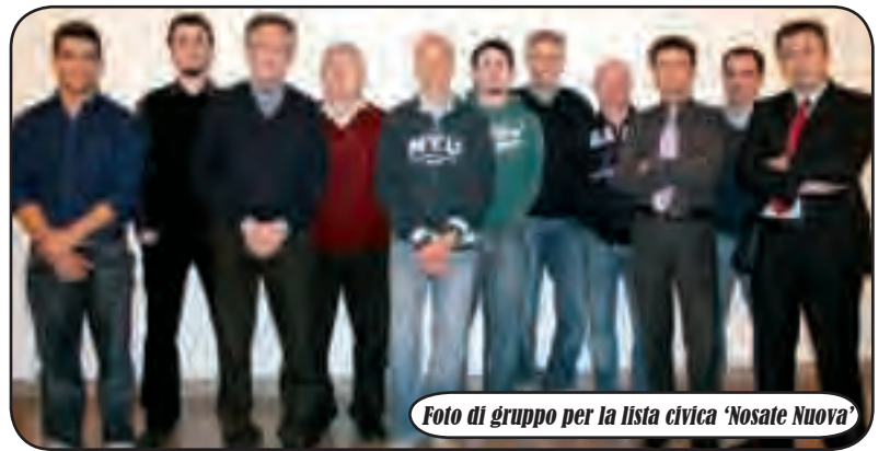
Foto di gruppo per la lista civica 'Nosate Nuova'