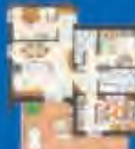
3 LOCALI - 114 mq. con cucina abitabile, doppi servizi e terrazzo