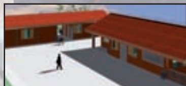
Buscate - pag. 14 I lavori del Polo Sportivo