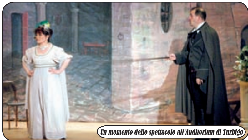
Un momento dello spettacolo all'Auditorium di Turbigo