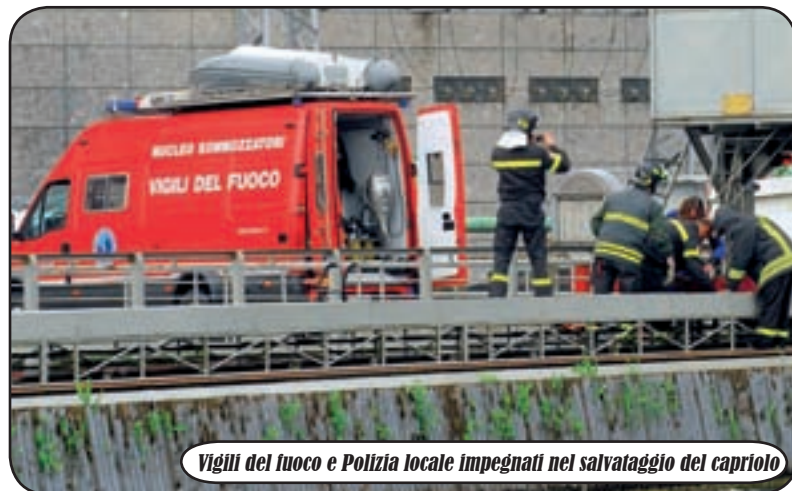
Vigili del fuoco e Polizia locale impegnati nel salvataggio del capriolo

S ingolare intervento nella mattinata di lunedì scorso a Turbigo. Anche se non è la prima volta che accade nella cittadina del nostro territorio, i Vigili del fuoco del distaccamento di Inveruno, gli agenti della Polizia locale del comando turbighese ed i sommozzatori di Milano sono stati chiamati per un capriolo che stava