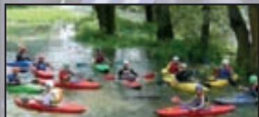
Sport - pag. 7 E' un Kayak Team da... record