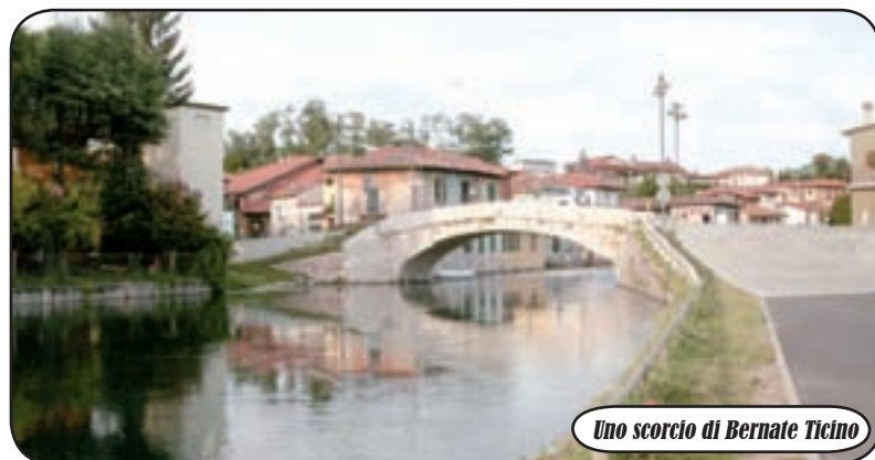
Uno scorcio di Bernate Ticino

gerimenti significativi e che potranno essere utili per la stesura del programma che è già in cantiere". Il questionario, in forma anonima, potrà essere riconsegnato ai gazebo che la sezione organizzerà oggi pomeriggio, sabato 14 febbraio, dalle 14 alle 18 in via Vittorio Emanuele a Bernate Ticino e domani, domenica 15, dalle 9 alle 12 in via IV Novembre, nei pressi della Chiesa Parrocchiale della frazione di Casate, oppure tutti i giovedì dalle 21 presso la sede della Lega Nord - Lega Lombarda in via Roma, 2, a Bernate Ticino.