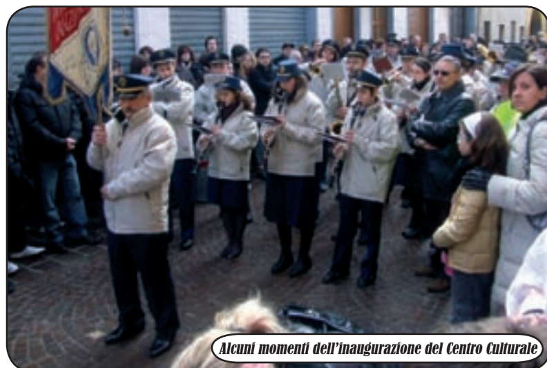
Alcuni momenti dell'inaugurazione del Centro Culturale

ca, mentre al piano terra si trovano un'ampia galleria vetrata a disposizione per mostre ed incontri, una sala adibita a ludoteca per bambini dai 3 mesi in poi, un ufficio dove avranno sede i servizi di 'Infoenergia', della 'Dorsale Verde' ed altre attività sovracomunali. A completare l'edificio, completamente ristrutturato, il salone per il 'Centro Giovanile Controcorrente', gestito in collaborazione con la Cooperativa 'Albatros'. A fare da sfondo alla bellissima giornata, che è proseguita anche nel pomeriggio, una mostra fotografica che ha ripercorso vari decenni della cittadina.