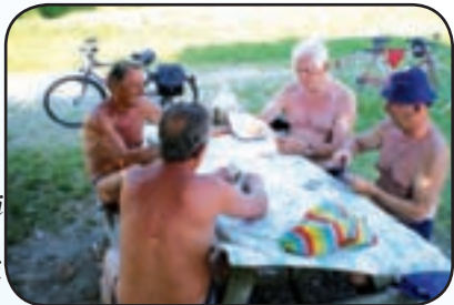
Amici 'Club del Platano'

Sulla riva del Ticino, nel territorio cuggionese, gli Amministratori del Parco, tanti anni or sono, avevano posizionato sotto un platano due tavoli e quattro panchine di legno, erano bellissimi e il posto era diventato il punto di riferimento e ritrovo per amici di tutti i paesi vicini. Si facevano nuove amicizie, si giocava a carte, si discuteva di tante cose, si guardava scorrere l'acqua del fiume e si tornava a casa alla sera, dopo aver passato diverse ore in compagnia. Tavoli e panche, che avevano resistito alle piene del fiume: hanno ceduto invece alla furia dei nuovi barbari, che nel settembre 2008 hanno demolito tutto. Ci mancano parecchio, speriamo tanto e saremo grati agli Amministratori del Parco se vorranno e avranno i mezzi per ripristinare tutto come prima. Auguriamo anche ai nuovi barbari di trovare qualcosa di meglio da fare.