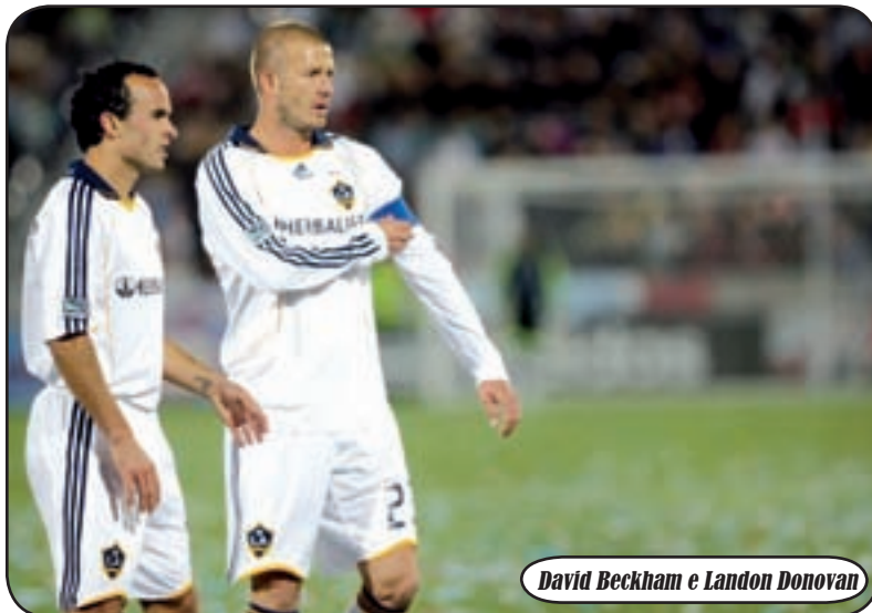
David Beckham e Landon Donovan

C ontinua a far parlare il passaggio di David Beckham al Milan. Se all'inizio si è discusso della scelta fatta dai rossoneri e della decisione del fuoriclasse inglese, con tutti i pro e i contro del caso, oggi a 'tenere banco' non è tanto la possibilità che la società di via Durini possa acquistare a titolo definitivo lo 'spice boy', quanto, invece, alcune dichiarazioni fatte nei giorni scorsi dal presidente dell'Uefa Michel Platini. Secondo quanto emerso, a turbare l'ex tre volte pallone d'oro e giocatore della Juventus sarebbe la durata del prestito del centrocampista dei Los Angeles Galaxy. "Il mio problema - avrebbe dichiarato Platini