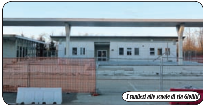
I cantieri alle scuole di via Giolitti