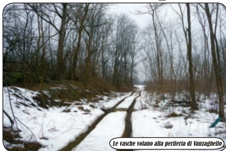
Le vasche volano alla periferia di Vanzaghella

N ei giorni scorsi alcuni cittadini di Vanzaghella ci hanno segnalato la presenza di alcune grosse vasche volano 'abbandonate' tra i campi ed i boschi, alla periferia della cittadina del nostro territorio. Così abbiamo deciso di andare a controllare di persona. Superata la strada Statale 341, che collega con Castano Primo e dopo essere scesi lungo