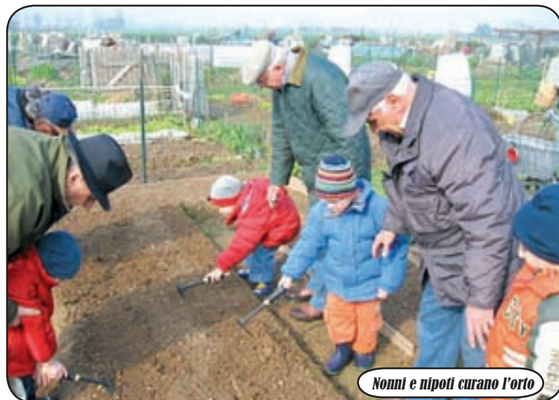
Nonni e nipoti curano l'orto

U n modo per riscoprire la natura, ma anche per imparare a gustare i sapori veri e salutari dell'agricoltura. "Buona parte dei nostri rifiuti casalinghi sono scarti di cucina. Questi nostri scarti sono una componente importante dei nostri rifiuti. Se ad essi sommiamo anche gli scarti verdi raggiungiamo quote di oltre il 35%. Anziché rifiuti potrebbero invece essere una risorsa importante da utilizzare direttamente in un piccolo orto o giardino e generare un risparmio alle famiglie come avviene in diversi comuni a noi vicini. Come? Attraverso il compostaggio domestico. Cosa è? E' semplicemente la trasformazione in fertile humus dei nostri scarti verdi o di cucina. Come lo si produce? Ci sono diversi modi, adatti sia a chi ha un piccolo giardino, sia a chi dispone di un cortile, o anche solo di un balcone. Come produrre il compost e come condurre un piccolo orto sarà il tema di alcuni incontri che stiamo organizzando. Crediamo sia un modo