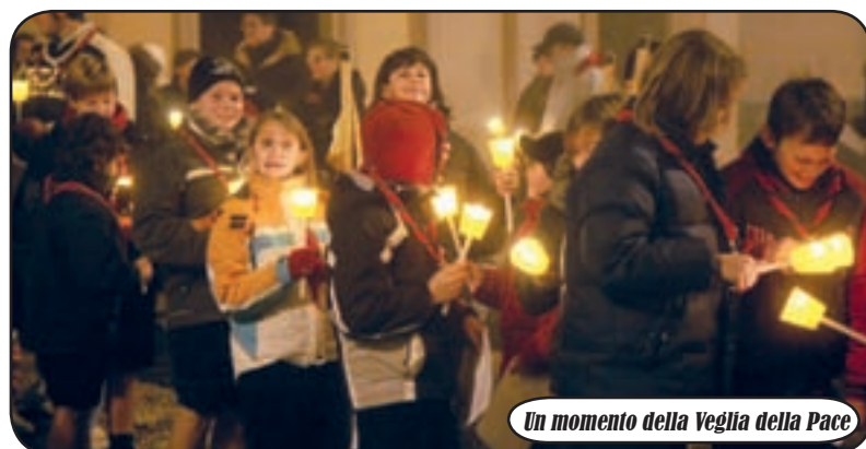
Un momento della Veglia della Pace

ziani che si sono dati appuntamento per condividere questa iniziativa di solidarietà verso il prossimo e verso tutte quelle popolazioni che soffrono. I presenti si sono ritrovati davanti alla Parrocchia di San Zenone, quindi, con le fiaccole accese in mano, hanno dato inizio alle Veglie ed alla Fiaccolata, fino a raggiungere la Madonna dei Poveri, dove c'è stato il momento di preghiera e di riflessione conclusivo da condividere tutti insieme.