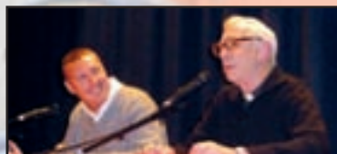
► Inchiesta - pag. 11 Come cambiano gli Oratori