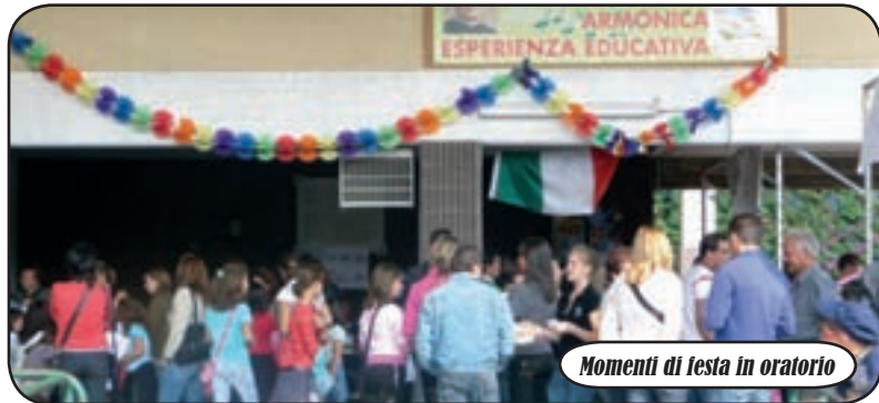
Momenti di festa in oratorio