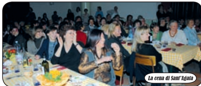
La cena di Sant'Agata