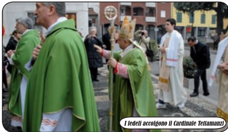
I fedeli accolgono il Cardinale Tettamanzi

M omenti di grande emozione e di coinvolgimento la scorsa domenica 1 febbraio a Ferno. Infatti, è arrivato in visita il Cardinale di Milano Dionigi Tettamanzi, in occasione dei 10 anni della Madonna dei Cintura. L'Arcivescovo, accompagnato dalle note del Corpo Musicale, dopo aver salutato i numerosi fedeli che lo attendevano sul sagrato della Chiesa Parrocchiale, ha celebrato la Santa Messa, pregando insieme a tutte le