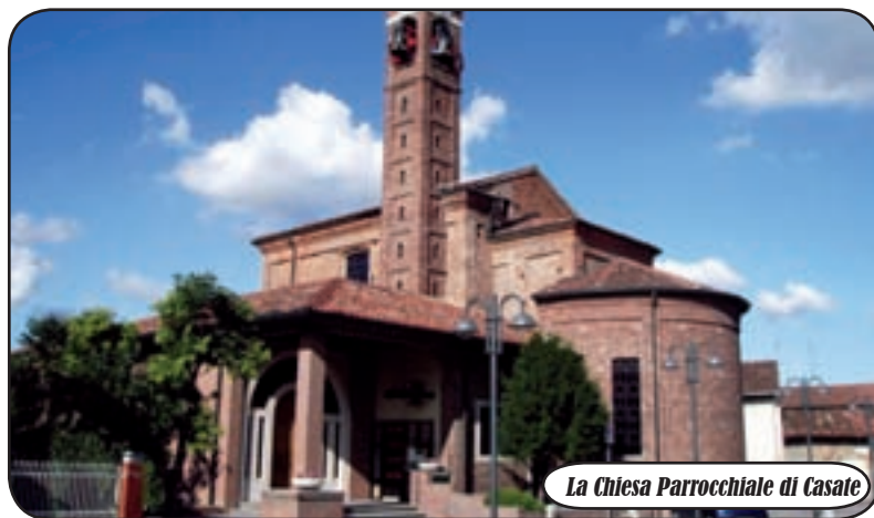
La Chiesa Parrocchiale di Casate

F ra lo stupore per l'incredibile e lo sdegno per un gesto deplorabile, si colloca una vicenda avvenuta in quella della parrocchia di Casate di Bernate Ticino. Nella chiesa del paese, e come del resto è uso comune in ogni luogo sacro riferibile alla sfera cattolica, sono dislocate delle cassette per le offerte. Queste ultime vengono per consuetudine svuotate da un addetto che, grazie a una specifica procedura, preleva il contenuto in banconote, buste sigillate o monete, e lo consegna al parroco. Una normale mattina, però, mentre l'incaricato compiva il procedimento ormai reso meccanico dall'abitudine, una sorpre-