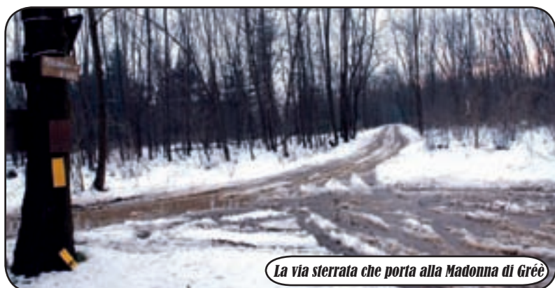
La via sterrata che porta alla Madonna di Grée