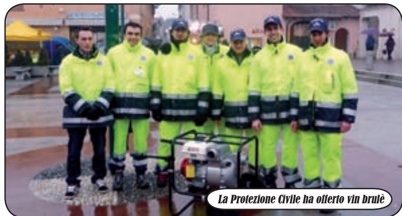
La Protezione Civile ha offerto vin brulé