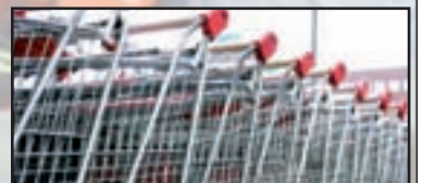
► Vanzaghello - pag. 21 'Si' al Centro Commerciale