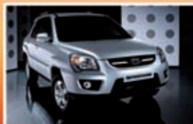
KIA SPORTAGE Fuoristrada