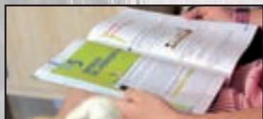
► Inchiesta - pag. 9 "Il mio primo giorno di scuola"