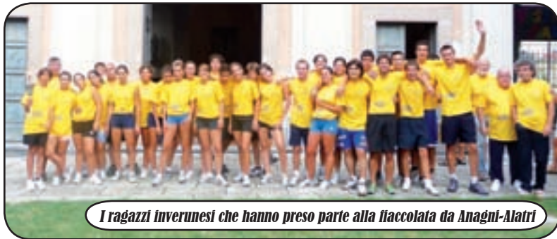
I ragazzi inverunesi che hanno preso parte alla fiaccolata da Anagni-Alatri