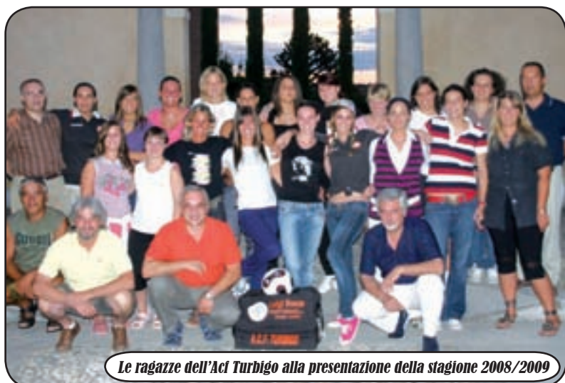
Le ragazze dell'Acf Turbigo alla presentazione della stagione 2008/2009