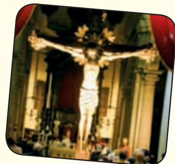
Il Santo Crocifisso di Castano Primo

La storia ufficiale del Santo Crocifisso di Castano Primo è tuttora avvolta nella leggenda. Secondo una prima versione, esso sarebbe stato portato da Gerusalemme al tempo delle crociate e donato alla parrocchia di Castano dal cavaliere di Malta fra' Rodolfo della Croce. Ipotesi più azzardate lo ritengono un'opera dell'evangelista san Luca. Una leggenda che si raccontava nel secolo scorso lo fa invece arrivare miracolosamente a Castano sulle acque del Ticino in piena. In realtà molto probabilmente è del principio del cinquecento, epoca in cui si ebbe, soprattutto a Milano, una notevole fioritura della devozione al Crocifisso. Già nel seicento il Crocifisso era considerato miracoloso e pertanto venne circondato da una grande devozione popolare che si intensificò nel secolo successivo. Numerose le preghiere ed i 'voti' a lui rivolti. Nel 1859, al tempo della seconda guerra d'indipendenza, si verificò un altro fatto in cui i castanesi ravvisarono una speciale protezione accordata dal Santo Crocifisso al paese e ai suoi abitanti. In seguito a questo fatto si stabilì, in segno di riconoscenza, di trasportare solennemente in processione il taumaturgo Crocifisso ogni venticinque anni.