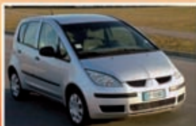
MITSUBISHI COLT Utilitaria