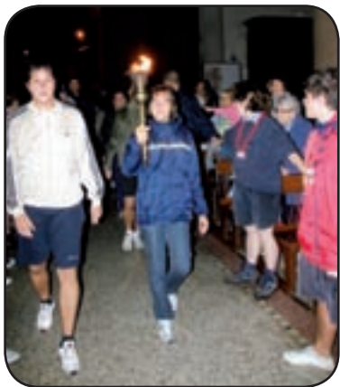
di Vittorio Gualdoni