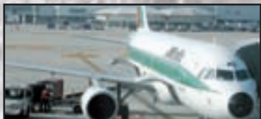
► Attualità - pag. 3 La crisi del gruppo Alitalia