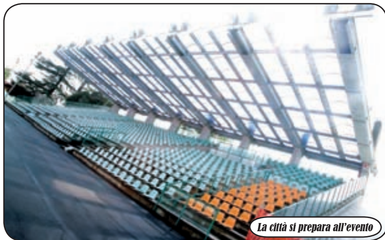
La città si prepara all'evento