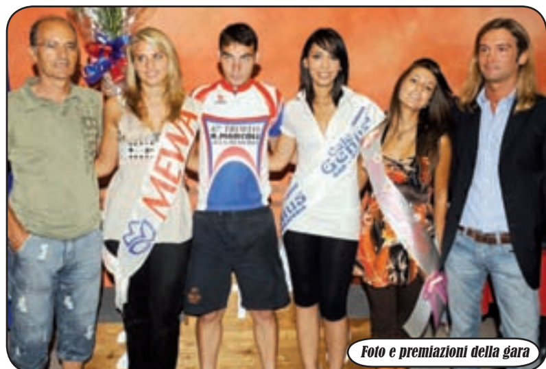
Foto e premiazioni della gara