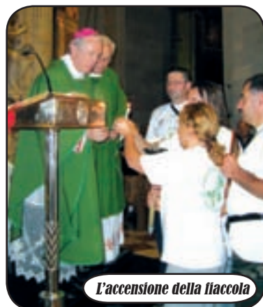
L'accensione della fiaccola

alternati correndo da mattina a sera in un continuo saliscendi su strade molto secondarie (ecco spiegati gli 800km...): impossibile enumerare le cittadine, le località, i paesini dispersi nel verde appenninico che sono stati attraversati tra lo sguardo a volte indifferente, a volte stupito, a volte incoraggiante della gente. E anche da casa, a Bernate, si continuava a collaborare. Si fa presto infatti a dire 'Fiaccolata' ma l'organizzazione di un evento così, è davvero impegnativo: il percorso, il pernottamento, la ricerca degli sponsor (anche quest'anno numerosi e generosi), la minuziosa burocrazia, ...occupano mesi e mesi di preparazione.