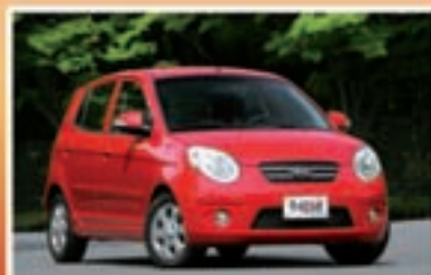
KIA PICANTO Utilitaria

MULTIMARCA: VENDITA AUTO - OFFICINA - RICAMBI ACCESSORI - GOMME - RICARICA CLIMA PROPONIAMO DIVERSI MODELLI DI AUTO BENZINA/GPL ANCHE CON 5 ANNI DI GARANZIA