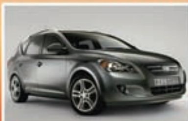
KIA CEE'D Media 0 SW