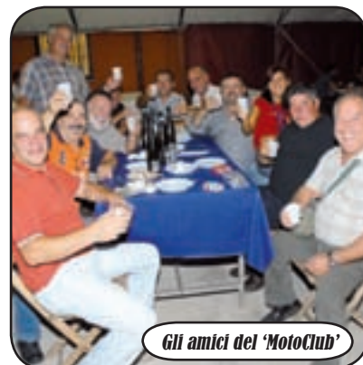
Gli amici del 'MotoClub'

che ci ospitava gli anni passati, ci siamo trasferiti presso l'Area feste di Via dei Campacci, molto più attrezzata per ospitare eventi di questo genere e già più conosciuta a livello locale". Infatti, nonostante il maltempo, che nella serata di sabato ha fatto saltare il live di ballo liscio con Fiorellone, il servizio di cucina e bar ha funzionato a pieno ritmo durante tutta la manifestazione, registrando un picco di prenotazioni proprio il sabato sera. Ma la giornata clou è stata domenica 14 settembre, con la Santa messa solenne delle 11, celebrata proprio in onore della Croce Azzurra, che ha