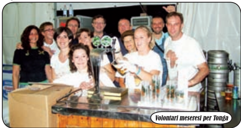
Volontari meseresi per Tonga

dei 'Gamba dei Legn'. 'Uno dei grossi problemi che abbiamo nella regione del South Nyanza - scrive Padre Filippo Astori, superiore regionale dei Missionari passionisti in Kenya, in una lettera inviata alla comunità meserese - è la diffusione dell'AIDS, che, insieme alla malaria ed altre cause, produce una crescita quotidiana di orfani'. Vi è quindi la necessità di realizzare strutture adeguate per accogliere questi ragazzi. Il progetto 'Mesero per Tonga - Costruiamo una speranza' vuole supportare la costruzione di case in mattoni per 12 ragazzi.