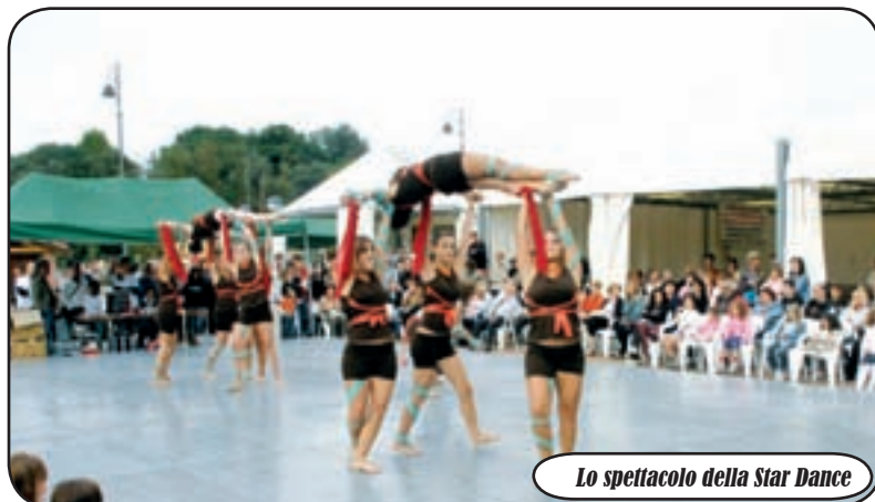
Lo spettacolo della Star Dance

L a pioggia ed il maltempo non hanno fermato la voglia di festa. E così, da giovedì scorso (11 settembre) a domenica 14, la bellissima e nuovissima area attorno alla piccola chiesetta di Santa Maria in Binda, nella cosiddetta Nosate in giù, è stata teatro della tradizionale festa, intitolata proprio a Santa Maria in Binda. Diversi e numerosi i momenti di divertimento e di unione che si sono potuti realizzare grazie all'impegno ed al duro lavoro di