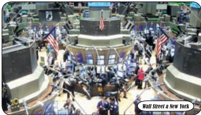
Wall Street a New York

- spiega - è la logica conseguenza dell'assurda posizione ostruzionistica assunta dalla Cgil in alleanza con le sigle autonome di piloti e assistenti". Ma nonostante ciò il ritiro di Cai è stato accolto positivamente tra i dipendenti Alitalia che si erano riuniti in assemblea all'aeroporto di Fiumicino. Non appena si è diffusa la notizia tra i circa mille dipendenti, sono scattati gli applausi. Alcuni piccoli spiragli sono stati lanciati dal Lufthansa e Air-France per riprendere le trattative. Ciò che però appare assolutamente grottesco è come un Paese come l'Italia rischi di non aver più una propria compagnia aerea di bandiera. Un'ipotesi ora molto concreta e che oltre al problema degli oltre 20.000 dipendenti, continua a mostrare al mondo l'immagine di un'Italia in forte crisi.