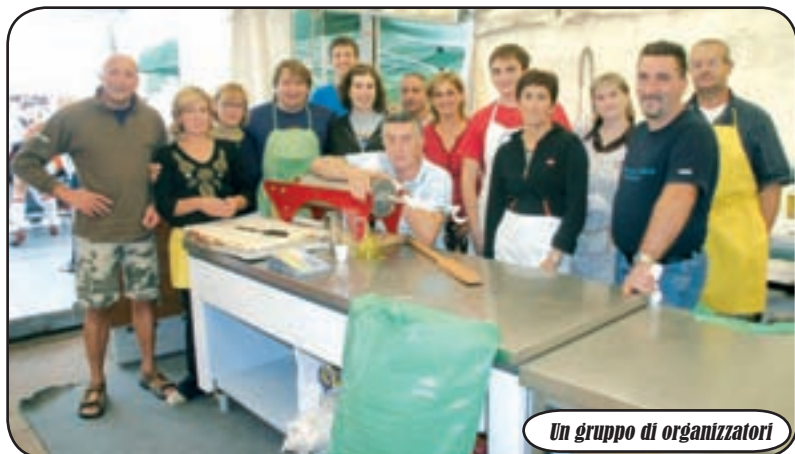
Un gruppo di organizzatori