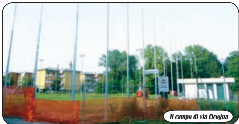
Il campo di via Cicogna