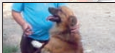
► Castano Primo - pag. 13 La storia di 'Due Calzini'