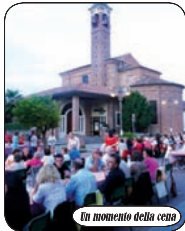
Un momento della cena

O re 18,20: l'ultimo autobus di linea è passato, si possono posizionare le transenne per bloccare il traffico nella via davanti alla chiesa: scatta l'operazione 'Cena in strada'. Uno stuolo di giovani e adulti caratterizzati dalla divisa rossa si muove freneticamente per allestire i posti a sedere di 200 persone; in cucina intanto le cuoche ultimano i dettagli del menù. La 'Cena in strada', giunta alla sua settima edizione, è ormai un appuntamento fisso della festa di Casate. Viene proposta dai Rioni paesani (che sono tre, Cà Nobil, Cà Vec e Cà Nov) come momento che inaugura la festa popolare di settembre. Come recita lo slogan di questa edizione, con la Cena in strada ci si ritrova in piazza per una cena in amicizia e una montagna di festa e allegria in compagnia. E il numero di persone che coglie l'invito...è sempre